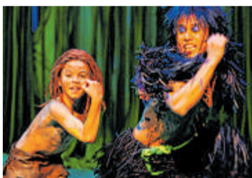
Der junge Tarzan und sein Freund.

Wer sich bewerben will, muss zwischen sieben und zwölf Jahre alt sein und nicht größer als 1,40 Meter. Er sollte aus dem Ruhrge-