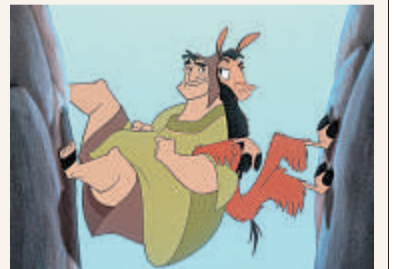
Der in ein Lama verzauberte Kuzco und der Bauer Patcha.